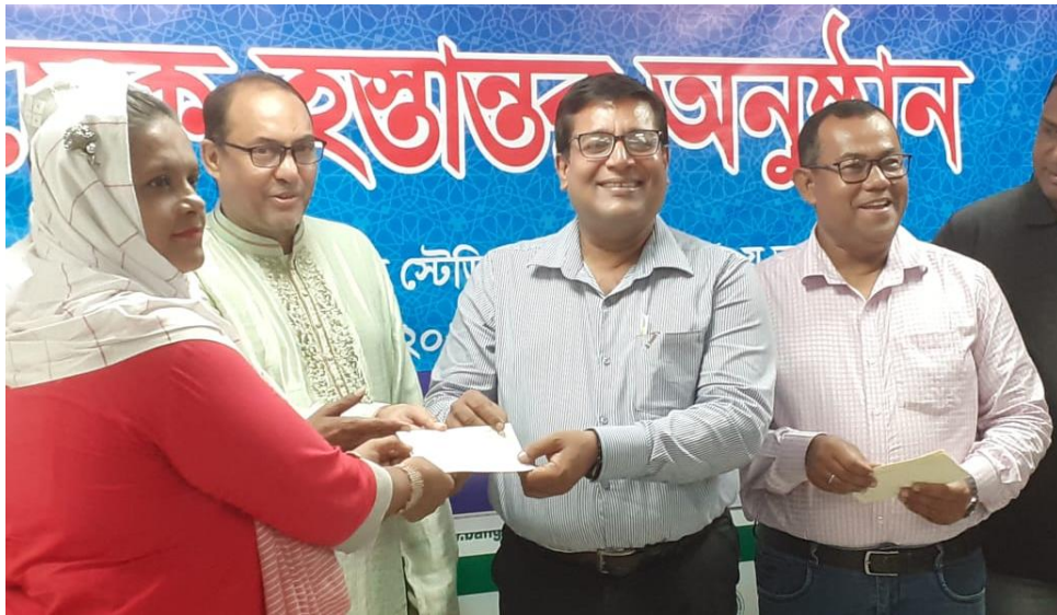
চিত্র-৪: করোনাকালীন বিশেষ অনুদানের চেক বিতরণ।

২০২১-২০২২ অর্থবছরে বঙ্গবন্ধু ক্রীড়াসেবী কল্যাণ ফাউন্ডেশন কর্তৃক ৭৭৬৭ (সাত হাজার সাতশত সাতষাট) জন অসচ্ছল ক্রীড়াসেবীদের প্রতিজনকে ৫,০০০/- টাকা হারে সর্বমোট ৩,৮৮,৩৫,০০০/- (তিন কোটি আটাত্তালিশ লক্ষ পঁয়ত্রিশ হাজার) টাকা করোনাকালীন বিশেষ অনুদান প্রদান করা হয়েছে।