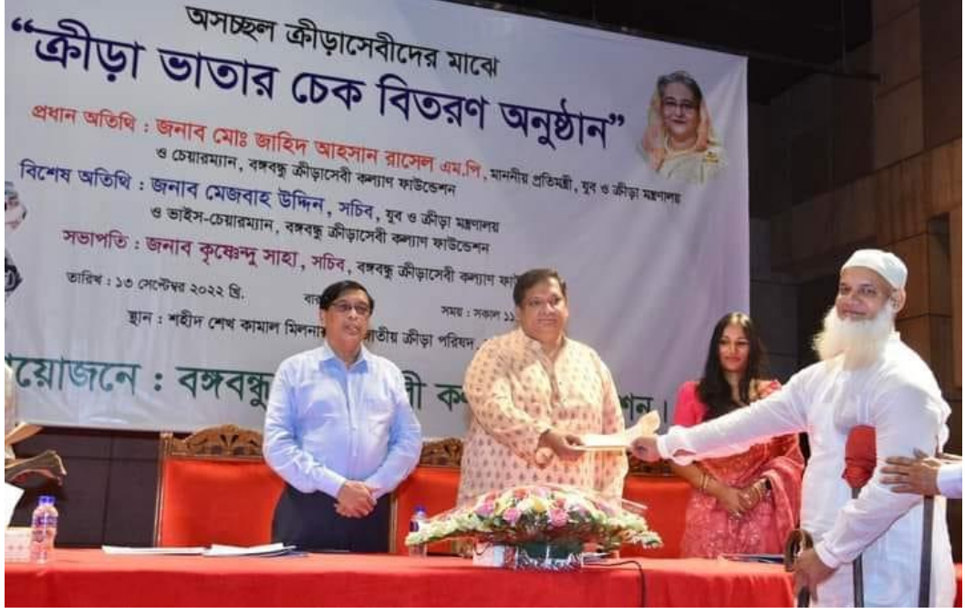
চিত্র-২: বঙ্গবন্ধু ক্রীড়াসেবী কল্যাণ ফাউন্ডেশন কর্তৃক ক্রীড়াসেবীর ক্রীড়া ভাতা প্রদান।