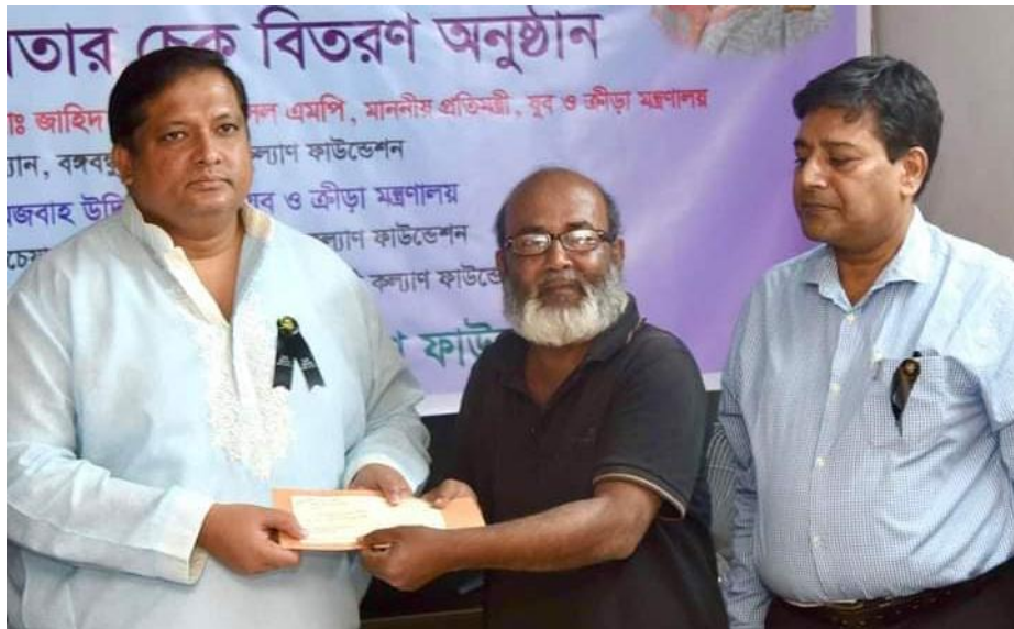
চিত্র-৩: ক্রীড়াসেবীদের চিকিৎসা ও আর্থিক সহায়তার চেক প্রদান করছেন যুব ও ক্রীড়া মন্ত্রণালয়ের মাননীয় প্রতিমন্ত্রী ও চেয়ারম্যান, বিকেকেএফ, জনাব মোঃ জাহিদ আহসান রাসেল এম,পি।

বঙ্গবন্ধু ক্রীড়াসেবী কল্যাণ ফাউন্ডেশন কর্তৃক ২০১৮-২০১৯ অর্থবছর থেকে অসচ্ছল, আহত ও অসমর্থ ক্রীড়াসেবীদের মাঝে চিকিৎসা সহায়তা প্রদান করা হচ্ছে। ২০২২-২০২৩ অর্থবছর পর্যন্ত সর্বমোট ১৬৪ জন ক্রীড়াসেবীদের-কে চিকিৎসা/আর্থিক সহায়তা হিসেবে ১,৮৯,০০,০০০/- (এক কোটি ঊননব্বই লক্ষ) টাকা প্রদান করা হয়েছে।